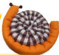
伝えたいでんちゃん

認知症の普及啓発活動「でんちゃんプロジェクト ：姫路市大的地域包括支援センター主催」で 大活躍の「でんちゃんワッペン」を 一緒に作ってみませんか？