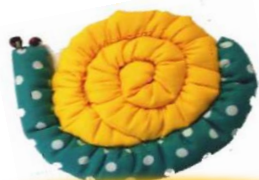
出かけたいでんちゃん